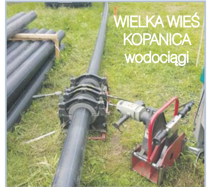
WIELKA WIEŚ KOPANICA wodociągi