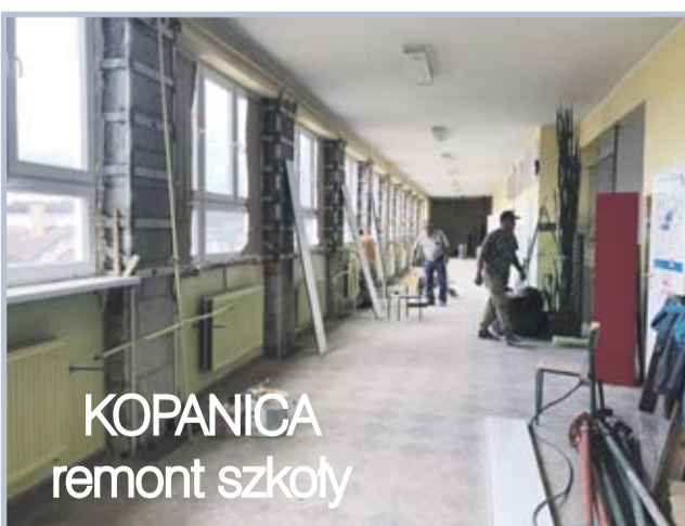
KOPANICA remont szkoły