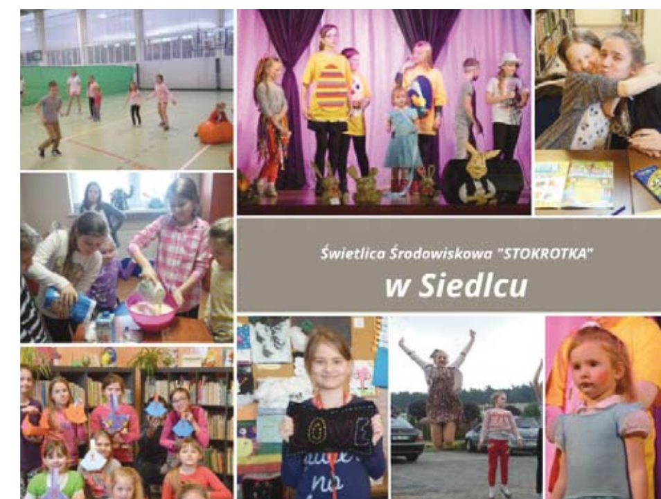
Świetlica Środowiskowa "STOKROTKA" w Siedlcu

na konkurs plastyczny pt. „Jedź i żyj zdrowo”, którego celem jest poszerzenie wiedzy o podstawowych zasadach zdrowego żywienia i aktywności fizycznej. W piątek, 17 czerwca, z okazji Dnia Dziecka wybieramy się na wycieczkę rowerową do Grójca Malego na ognisko.