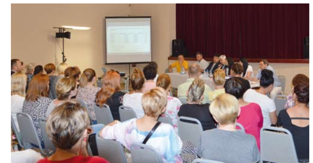
Spotkanie z rodzicami dzieci przedszkolnych w dniu 9 czerwca.