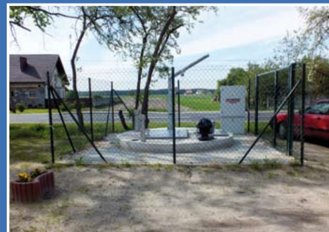
Tłocznia ścieków w Chobienicach