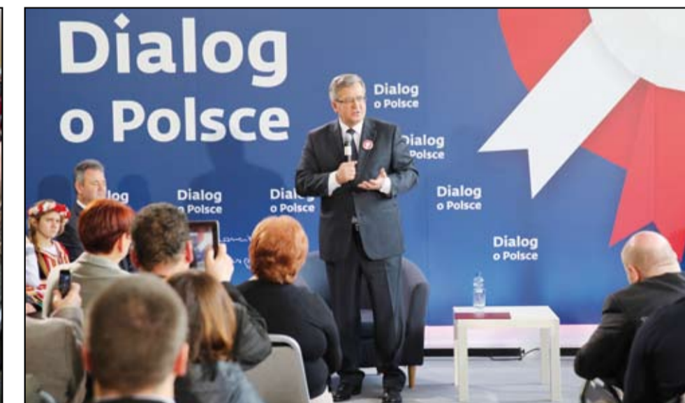
Prezydent RP dziękuje za serdeczne przyjęcie w naszej gminie. Spotkanie trwałoby dłużej gdyby nie wyjazd Prezydenta w dniu następnym do Tunezji na marsz przeciw terroryzmowi.