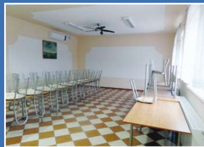
Sala wiejska w Grójcu Małym