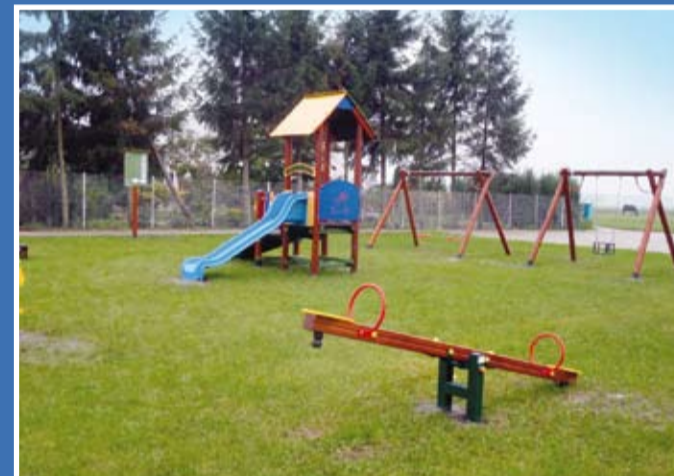
Plac zabaw w Nieborzy